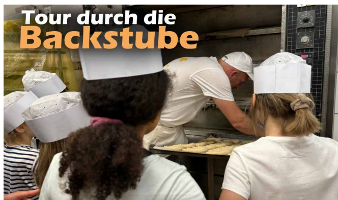
Grundschüler zu Besuch bei der Beckerei Saur

Ein besonderes Highlight war das Brezelschlingen, bei dem die Kinder selbst aktiv werden durften. Mit viel Geschick und Kreativität formten sie ihre eigenen Brezeln. Die Betreuer:innen und die Bäcker:innen standen ihnen dabei mit Rat und Tat zur Seite und sorgten dafür, dass alle kleinen Bäckerinnen und Bäcker viel Spaß hatten und mit gutem Appetit eine frisch gebackene Brezel essen durften. Im Jahr 2024 nahmen insgesamt 145 Kinder in allen Schulferien, außer den Weihnachtsferien an der Ferienbetreuung teil.