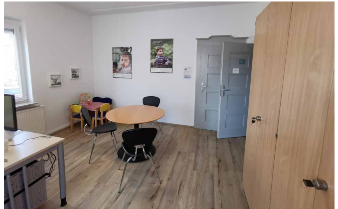
Geräumige Büros zum Arbeiten und Beratung von Eltern und Tageseltern

ballons vorbereitet. Als Erinnerung an diesen besonderen Tag wurde ein Bild mit Fingerabdrücken aller Gäste gestaltet, welches im Eingangsbereich aufgehängt wurde.